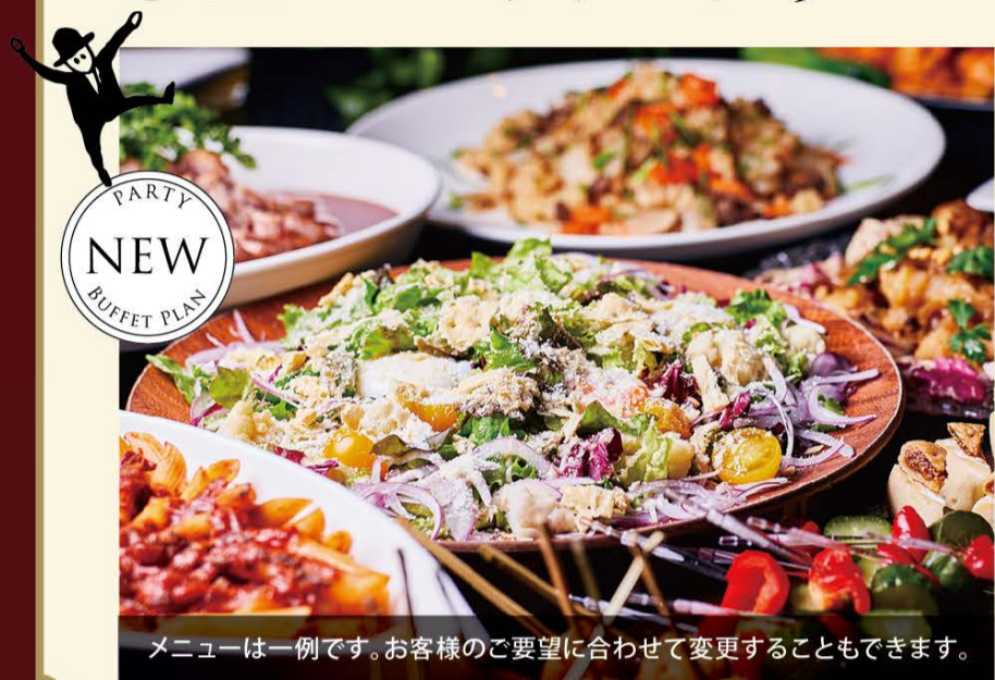
メニューは一例です。お客様のご要望に合わせて変更することもできます。